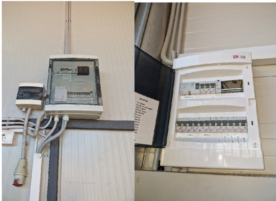
Slika 2: Razdelilne el. omarice