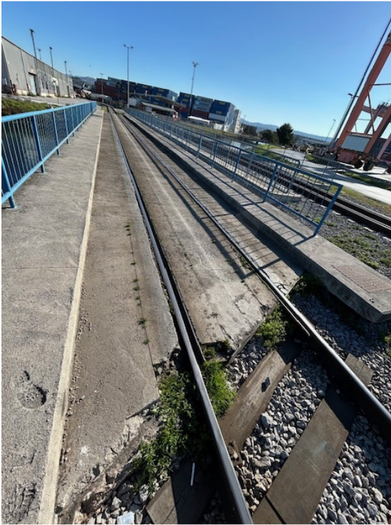
Slika 2: Tir 25c na zahodnem delu mostu št.1