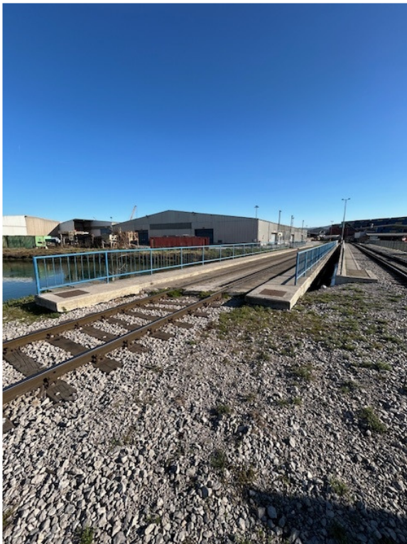
Slika 4: Tir 25c na vzhodnem delu mostu št.1