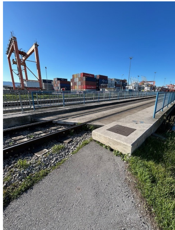
Slika 5: Tir 25c na vzhodnem delu mostu št.1