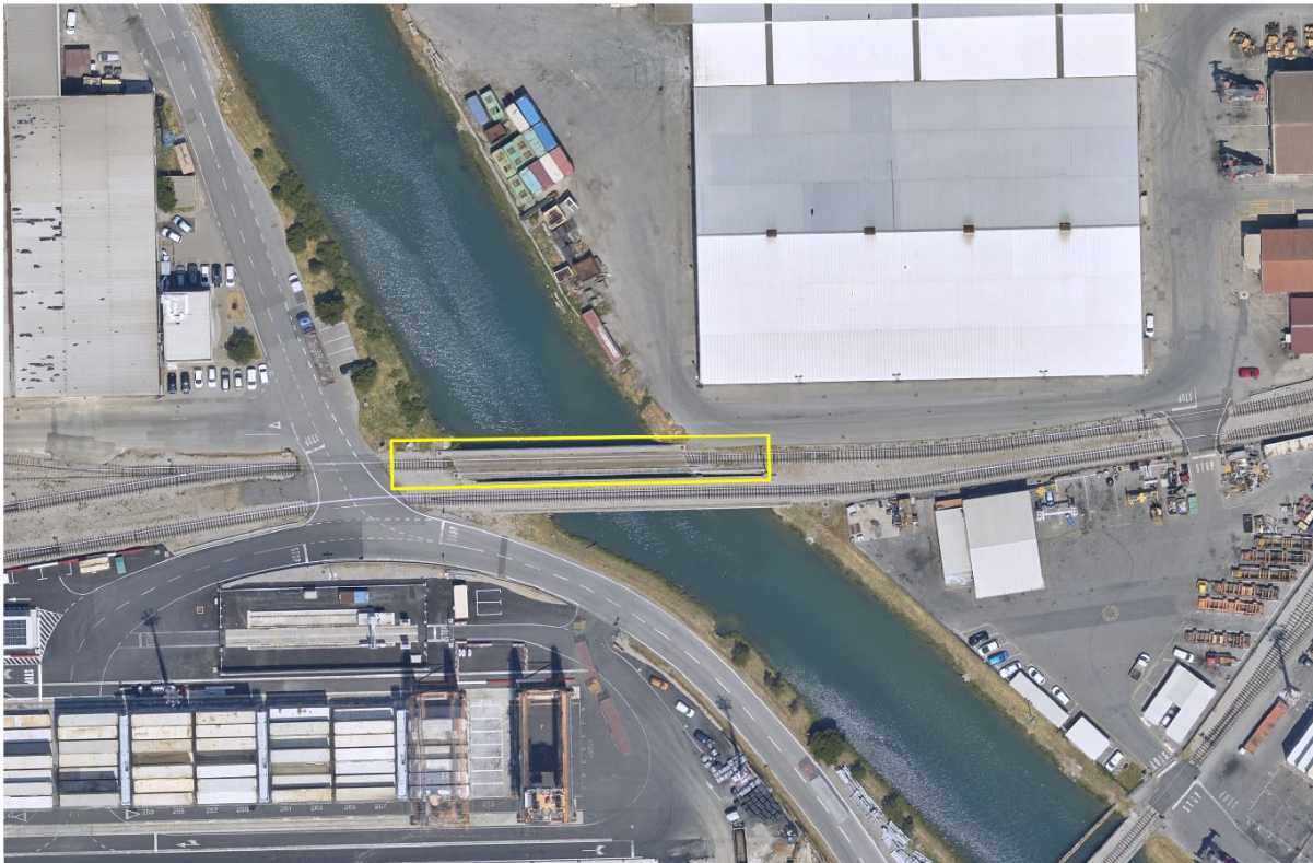
Slika 1: Območje posega: Obnova tira 25c na km 0+319,43 (mostu št.1)