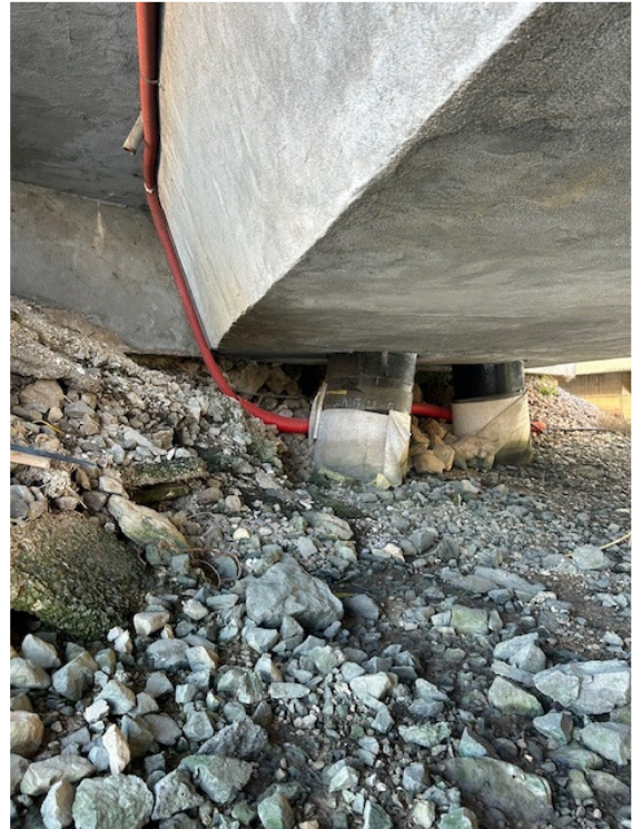
Slika 7: Podporniki vzhodni del mostu št.1

Pri rednem pregledu tirov II. tirne skupine industrijskega tira Luka Koper je bilo ugotovljeno, da tir 25c na mostu št.1 ob prehodu vlakovne kompozicije višinsko zaniha 2-3cm, kar kaže na poškodbe podpore tirnic. Tirnice so na območju mostu žlebate, tipa 57R1, brez pragov, postavljene na distančnike in pritrjene s pritrtilno maso.