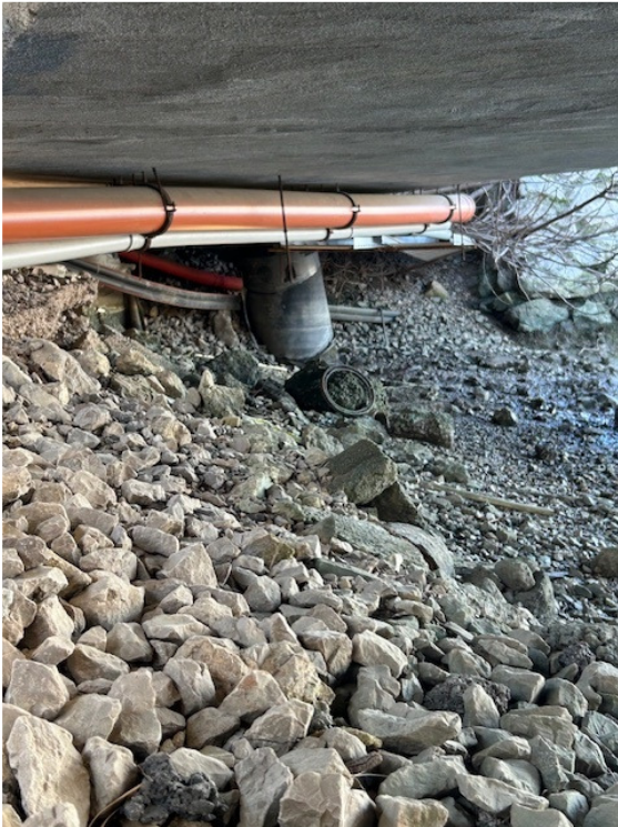
Slika 6: Podporniki zahodni del mostu št.1