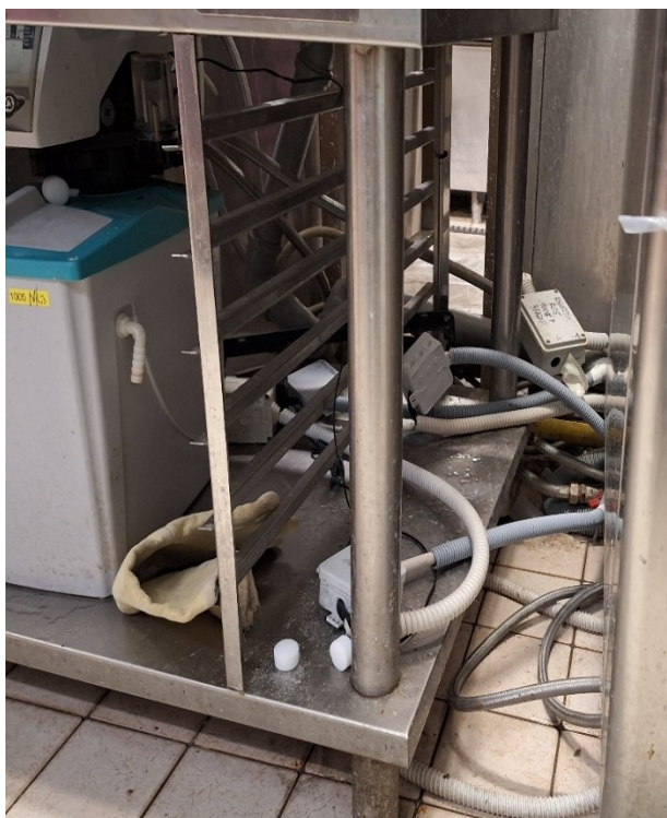
Slika 1: »Konvekcijske pečice«

Dela bodo potekala v skladu z veljavnimi tehničnimi standardi in varnostnimi predpisi. Ključno je usklajevanje z obratovanjem kuhinje, pri čemer bodo dela verjetno potekala ob nedeljah, ko kuhinja ne deluje, da se zagotovi nemoteno delovanje vseh kuhinjskih procesov.