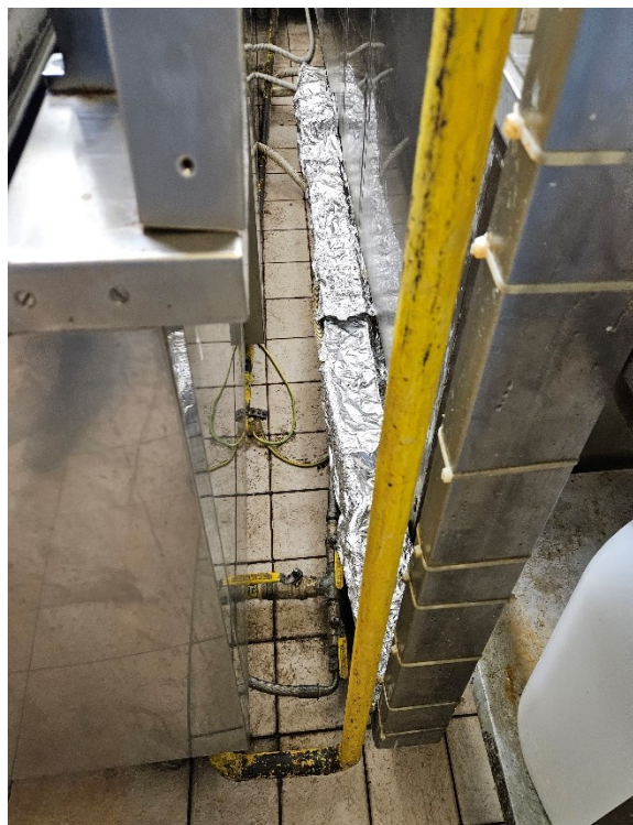
Slika 1: »Trenutni priklop«