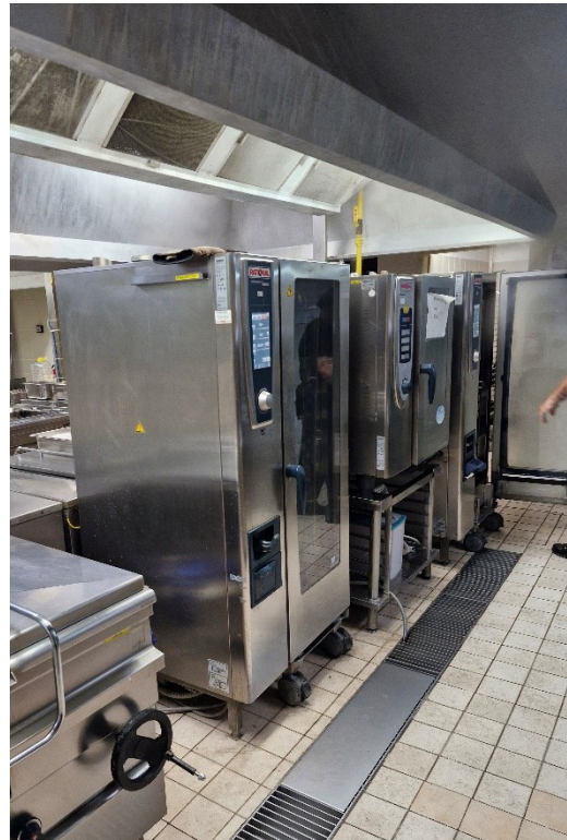
Slika 3: »porabniki na linijah«