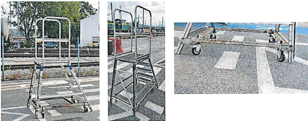
Slika 1: Obstoječe mobilne stopnice s podestom

Zaradi kontinuiranega pregledovanja praznih kontejnerjev na vratarnici Depo so trenutne mobilne stopnice s podestom po sami obliki primerne, ne pa po načinu izdelave. Potrebno je nabaviti podeste močnejše konstrukcije, z centralno prednjo zavoro, ki se bi jo z nogo aktiviralo pred vzpenjanjem na podest. Vsa kolesa morajo biti vrtljiva zaradi lažjega manipuliranja. Podest mora imeti tudi snemljivo varovalno ograjo in omogočati vstop v kontejner, ki je na kamionski prikolici.