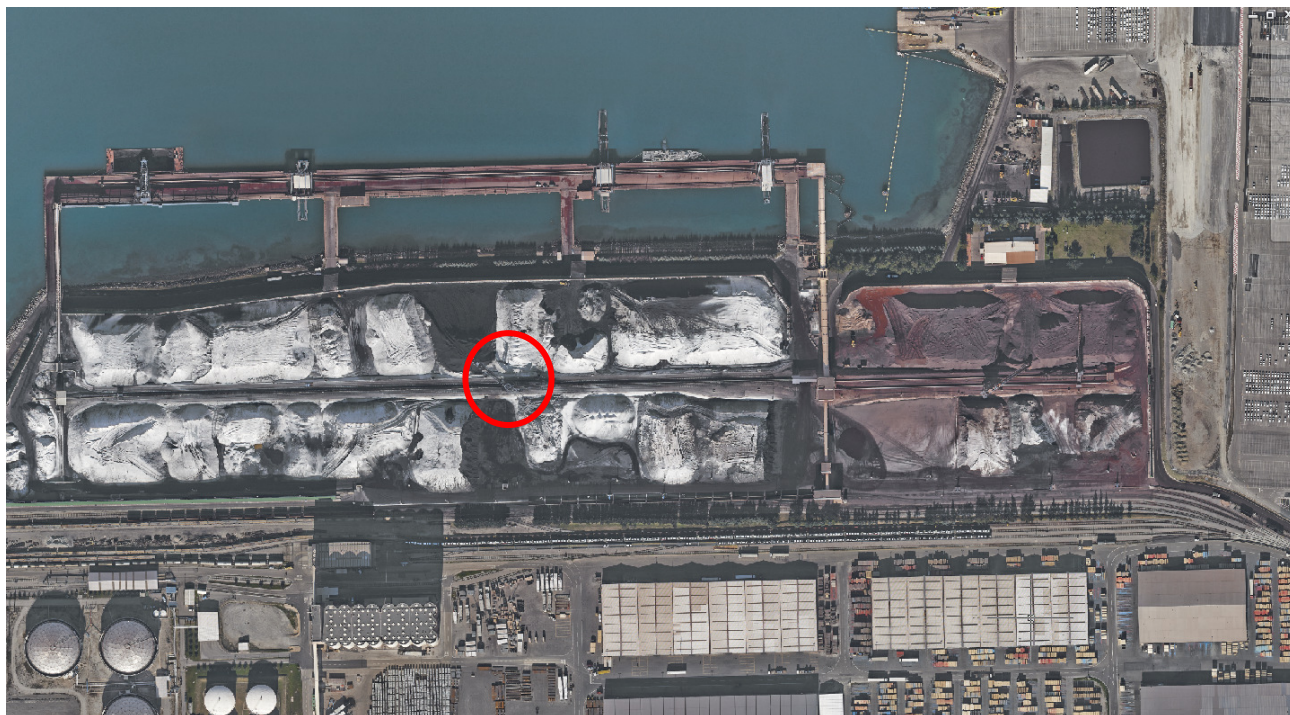
Slika 1: Lokacija kombiniranega stroja (KS)