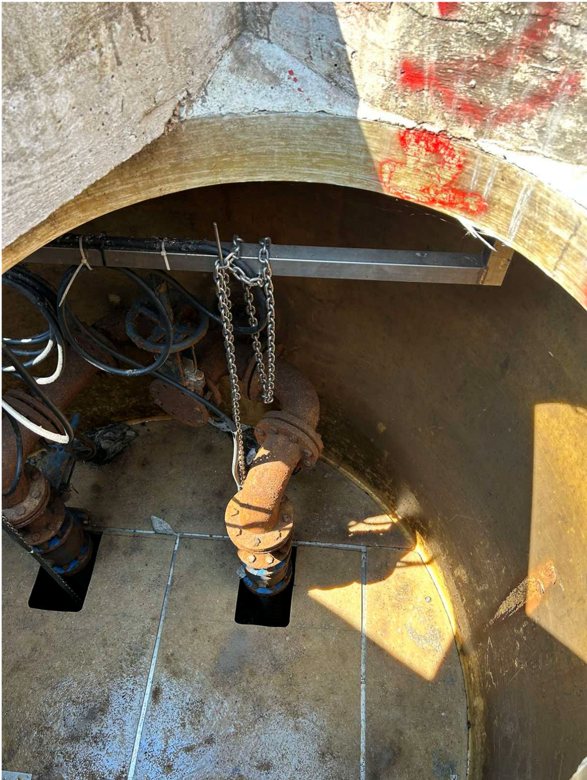
Slika5: Drog za pomoč pri dvigu črpalk in zaporni ventil