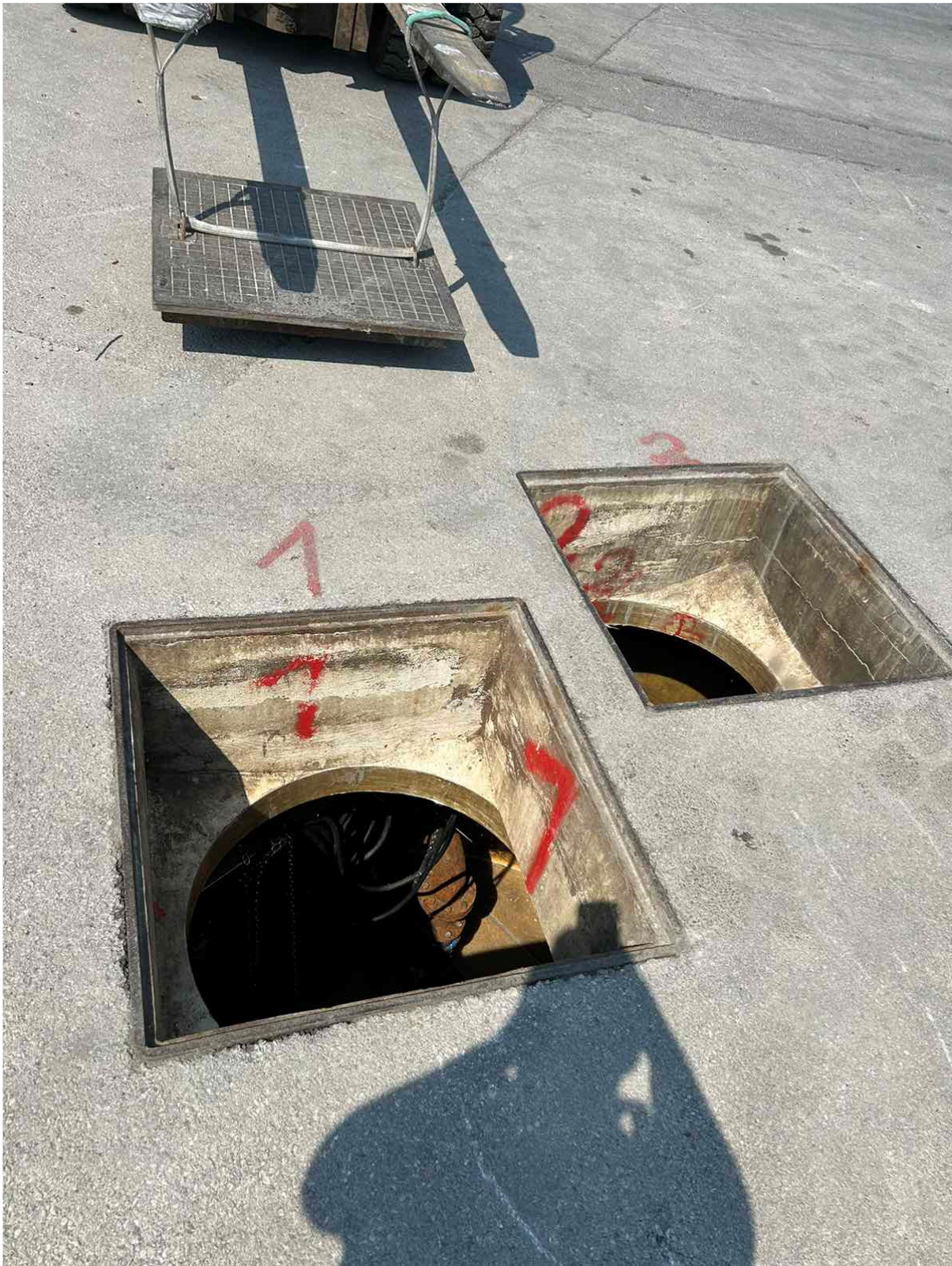
Slika1: Območje fekalnega črpališča z dvema revizijskima jaška z dostopom do črpalk in rezervoarja