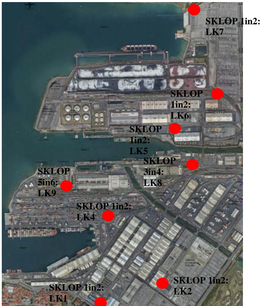
Slika 1: Prikaz lokacij

Ograditev gradbišča in gradnja: Glede na razpršenost gradnje je potrebno pri vsaki lokaciji urediti gradbišče vsaj z označitvijo in ograjo oz. tako da bo delovišče oz. gradbišče urejeno v skladu z zakonodajo.