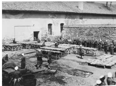
V tovarni so uporabljali tako notranje prostore kot zunanje površine, zato se je okrog objekta običajno širil prepoznavni vonj.