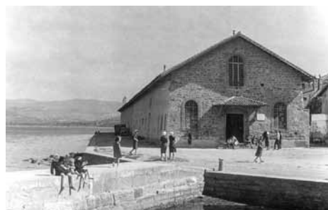
Tovarna za predelavo rib De Langlade.