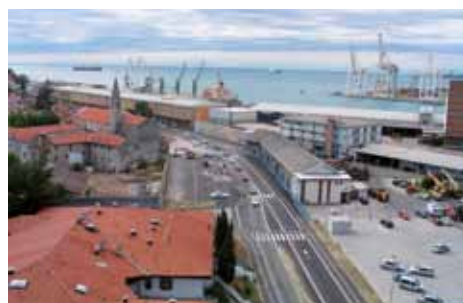
Veliko spremembo je prineslo obdobje po letu 2005, ko je Luka Koper 30.000 m 2 površin odstopila mestu Koper, ki je med Bošadrago in pristaniščem zgradilo t. i. koprsko obvoznico. Porušena je bila večina prizidka, ki ga je uporabljala luška enota vzdrževanja in tudi manjši del objekta De Langlade.