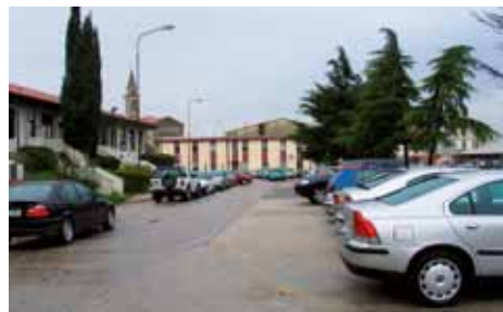
V sedemdesetih letih so ob skladišču prizidali del nove stavbe (rumen objekt v sredini), ki so jo namenili takratni enoti vzdrževanja. Na levi viden objekt, kjer je danes restavracija Pristan.