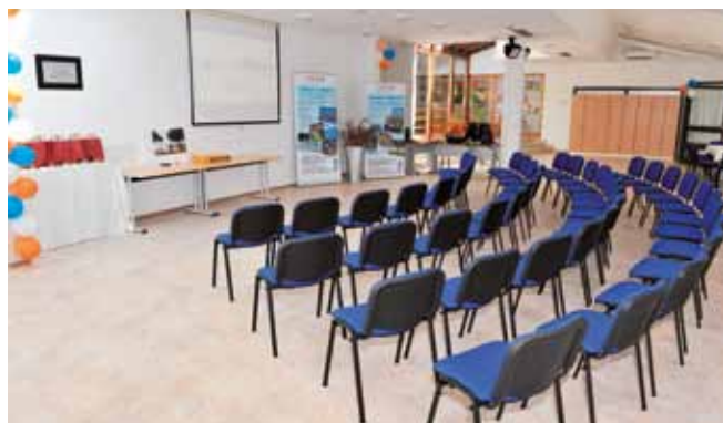
Večnamensko dvorano so uredili na lokaciji starega bazena, uporabljajo pa jo za prireditve in številne dejavnosti otroških skupin, za kar potrebujejo urejene zaprte prostore.

letovanje in uspešno zdravljenje otrok iz socialno ogroženih okolij iz cele Slovenije in tudi tujine. Od skromnih začetkov do danes so na obsežni površini zdraviliškega kompleksa zrasli številni nastanitveni objekti, jedilnice, zdraviliški objekti, bazeni, športna igrišča, vse skupaj pa v celoto povezujeta morje na eni in mediteransko rastje na drugi strani.