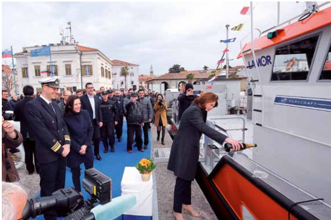
Novo plovilo je za "SI-20" na dan pomorstva, 7. marca, slavnostno krstila Alenka Bratušek, ministrica za infrastrukturo. Čoln je državo stal 1,78 milijona €.

Plovilo so izdelali v finski ladjedelnici Lamor in je že 369. ekološko plovilo, ki so ga izdelali in nanj namestili opremo in orodje za akcije na morju. Za slovensko plovilo so po naročilu izdelali posebno mrežo, s katero bodo lahko z morja pobirali plavajoče kose plastike.