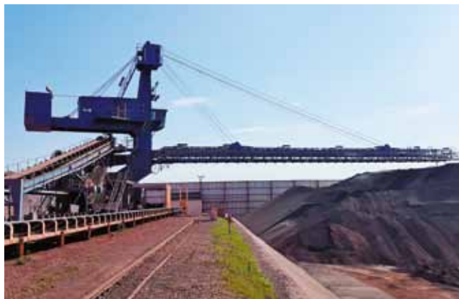
Priključna moč odlagalca na deponiji EET je 145 kW, z njim pa pretovorimo 2.000 ton na uro.

Za zelo dobro sodelovanje med obnovo in ustrezno pripravo stroja se zahvaljujem Jadranu, Mariu in Boštjanu s terminala EET, pohvala pa gre tudi izvajalcem del in celotni ekipi za hitro in kvalitetno izvedbo del.