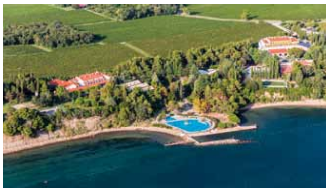
Mladinsko zdravilišče in letovišče Debeli rtič je prvi slovenski objekt, ki je bil zgrajen s prostovoljnimi prispevki in donacijami. Že leta 1956 je na Debeli rtič prispela prva skupina stotih otrok na letovanje, takrat še pod šotori. Leta 1963 so zgradili štiri mladinske domove s 500 ležišči, kar danes predstavlja 70 % vseh nastanitvenih kapacitet zdravilišča.

ranljivih skupin. Na leto sprejmemo okrog 16.000 otrok. Ker želimo mladim obiskovalcem ponuditi boljši namestitveni standard, smo prejšnja leta vlagali v posodobitev mladinskih domov. Luka Koper nam pri teh obnovah z donacijami intenzivno pomaga. Z njimi sicer sodelujemo že od nastanka. Med drugim smo prejšnjo zimo bazen v Hotelu Bor predelali v multifunkcijsko dvorano, ker otroci potrebujejo skupne prostore za izvajanje raznovrstnih aktivnosti.«