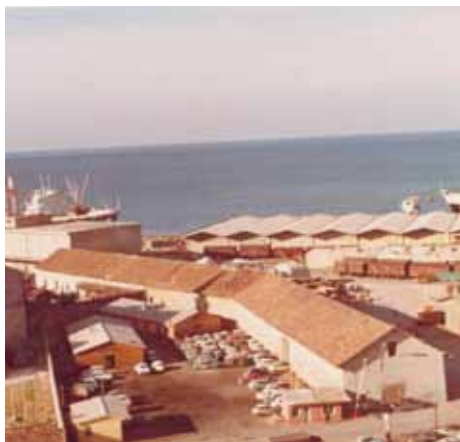
Tik ob objektu De Langlade so vstopali in izstopali tovarnjaki.

Ob objektu bivše tovarne De Langlade so 17. maja 1957 delavci Vodne skupnosti zabili prve pilote za zaporo Škocjanskega zatoka do izliva reke Rižane. Po zagonu dejavnosti v pristanišču so prostore De Langlade uporabili za skladiščenje luškega tovora, po izgradnji novih, sodobnih skladišč, pa so vanj preselili mehanične delavnice.