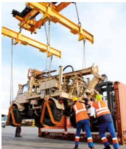
V delo so bili vpleteni kar trije terminali.

Posebnosti pri logističnem in pristaniškem poslu ni bilo, so povedali tako na FMS kot sodelavci iz Luke, so pa vsi s spoštovanjem pogledovali proti vedno prisotnemu Križnarju, ki je spremljal in s kamero dokumentiral skoraj vsak premik vozil.