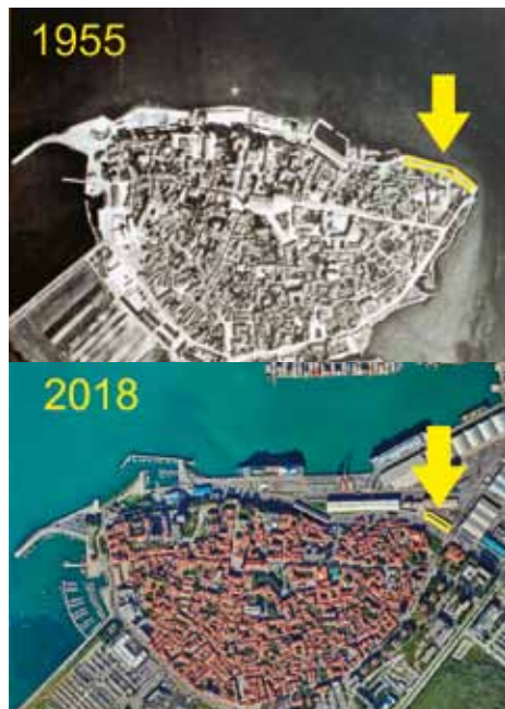
Koper leta 1955, tovarna De Langlade je izvirno stala prav na robu mesta, danes pa si to težko predstavljamo. (Foto: arhiv Luka Koper)

Vir: Razvoj industrijskega ribištva na Slovenski obali v letih 1945-1959 (Nadja Terčon), Črno bele fotografije: facebook, Koper, kot je bil nekoč