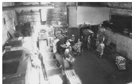
Od skupno 92 zaposlenih, je bila večina žensk (90%).