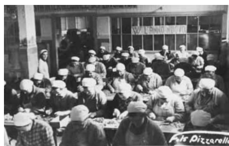
Ročno čiščenje rib.