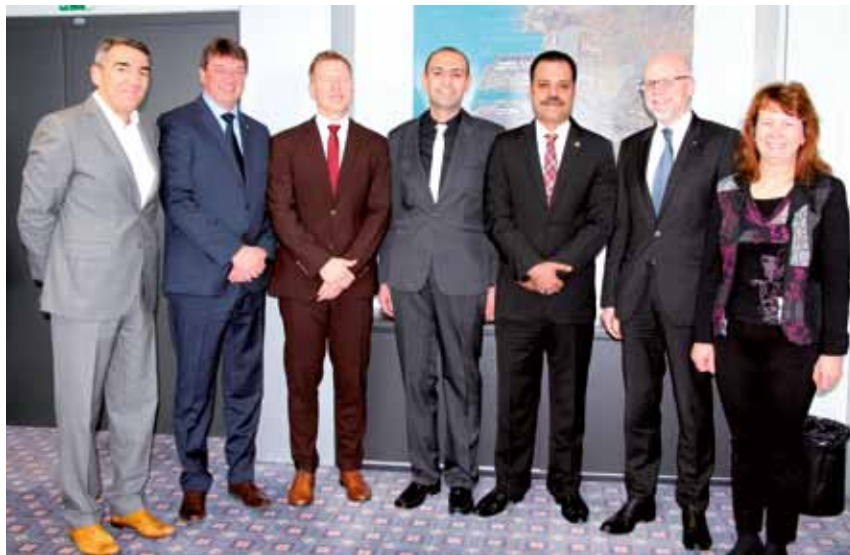
Sodelovanje s partnerskimi pristanišči poleg izmenjave izkušenj in dobrih praks krepi tudi poslovno povezovanje.