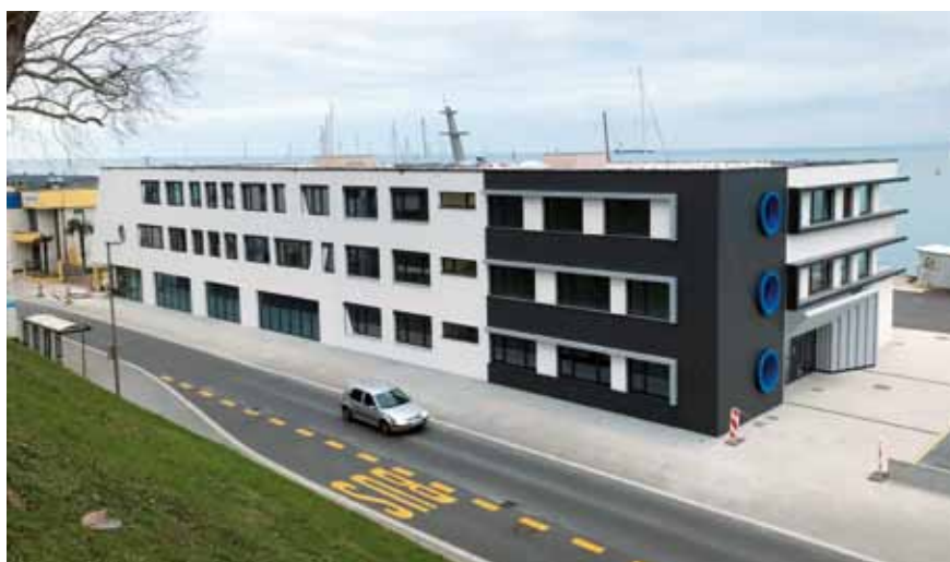
Nova zgradba uprave za pomorstvo tudi vizualno spominja na ladjo, ima pa končno direkten pogled tudi na območje, kjer tovarne ladje vstopajo in izstopajo iz pristanišča.

»Največ pričakujemo od novega nadzornega centra. Na 11 lokacijah od Slavnika do piranske Punte, od