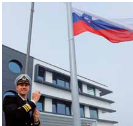
Jadran Klinec, direktor uprave RS za pomorstvo ob težkopričakovanem prevzemu novih prostorov.

URSP je 1. marca s prodajalcem Marino Koper opravila primopredajo novih poslovnih prostorov na Kopaliskem nabrežju 9 v Kopru. Nova zgradba URSP, ki arhitekturno spominja na ladjo, stoji zraven potniškega terminala Luke Koper in bo omogočala boljši in tehnično sodoben nadzor prometa na morju.