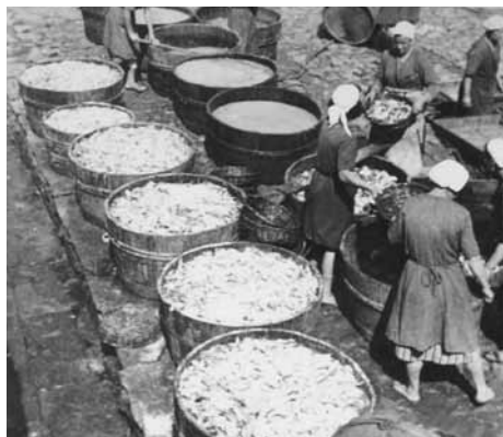
Ribe so solili sami in jih pozimi predelovali v filete.